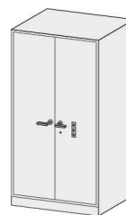
Armadio di sicurezza con combinazione