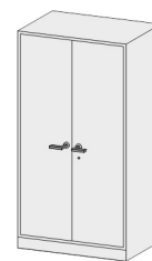
Armadio di sicurezza