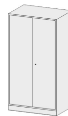
Armadio a forte spessore